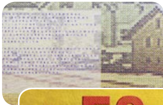
Mikroschrift ist ein kopiersicheres Merkmal

Eine erfolgreiche Partnerschaft beruht auf Vertrauen und gegenseitiger Wertschätzung. Bei Orell Füssli Sicherheitsdruck engagieren wir uns für Zuverlässigkeit und Diskretion. Der persönlichen Kundenbeziehung messen wir oberste Bedeutung bei. Wir handeln proaktiv. Mit innovativen Sicherheitsdokumenten unterstützen wir Sie darin, Ihre Werte zu schützen, damit Sie im Markt stets den entscheidenden Schritt voraus sind.