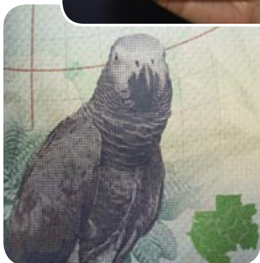
Le passeport: votre ambassadeur