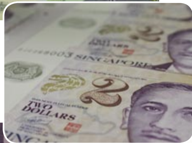
Impression de qualité sur support polymère