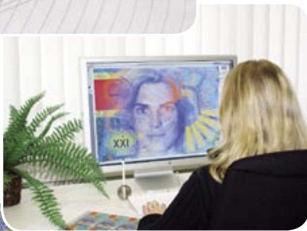
Conception assistée par ordinateur (CAO)