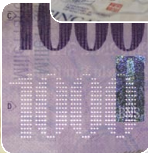
Microperforé – une caractéristique de sécurité démontrée