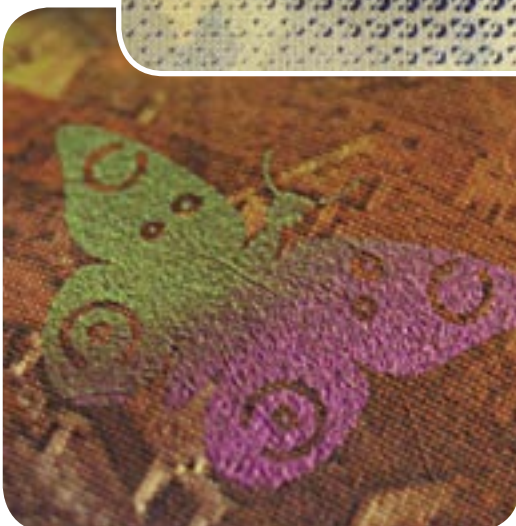
Les encres optiquement variables (OVI) produisent des changements de couleurs