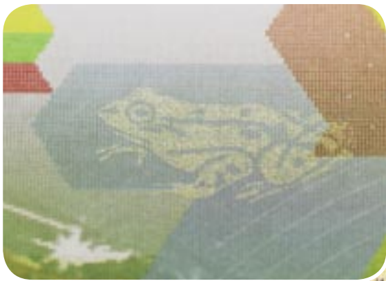
L'encre iridescente reste invisible à la photocopie

La créativité et l'impression de haute qualité d'un document de sécurité suscitent des émotions qui élèvent encore la valeur perçue du produit par le client.