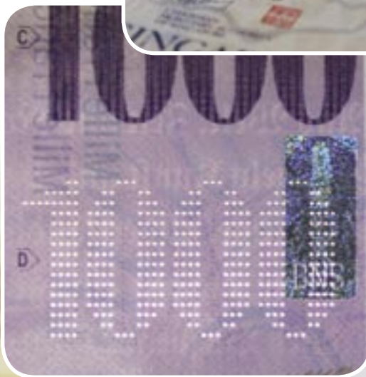
Microperforé – une caractéristique de sécurité démontrée