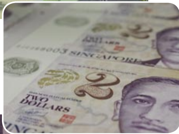
Impresión de calidad en sustrato polímero