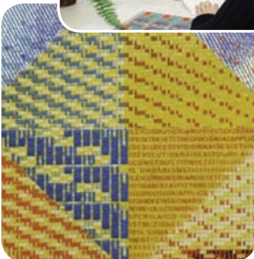
Impresión calcográfica altamente precisa con microletras nítidas